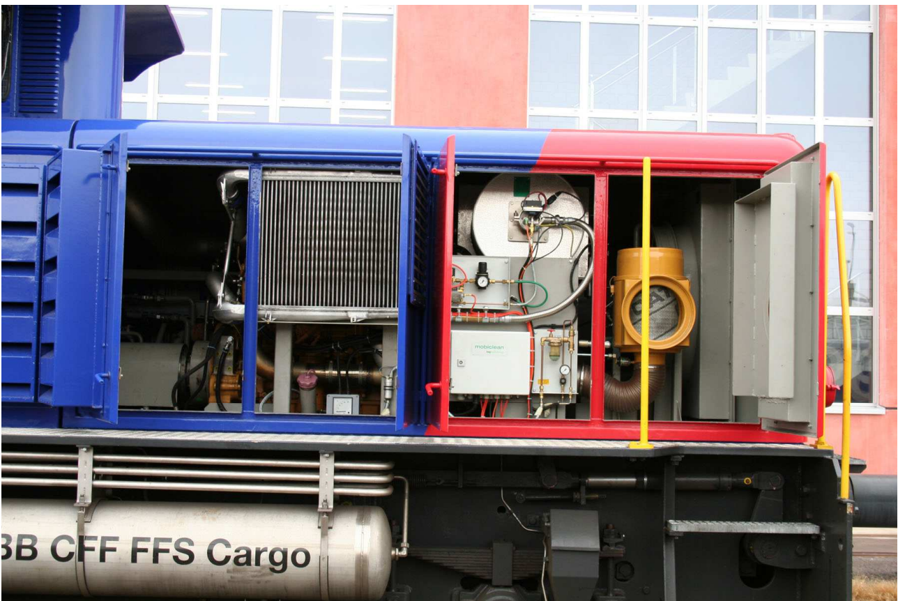
SBB Tm 232 111