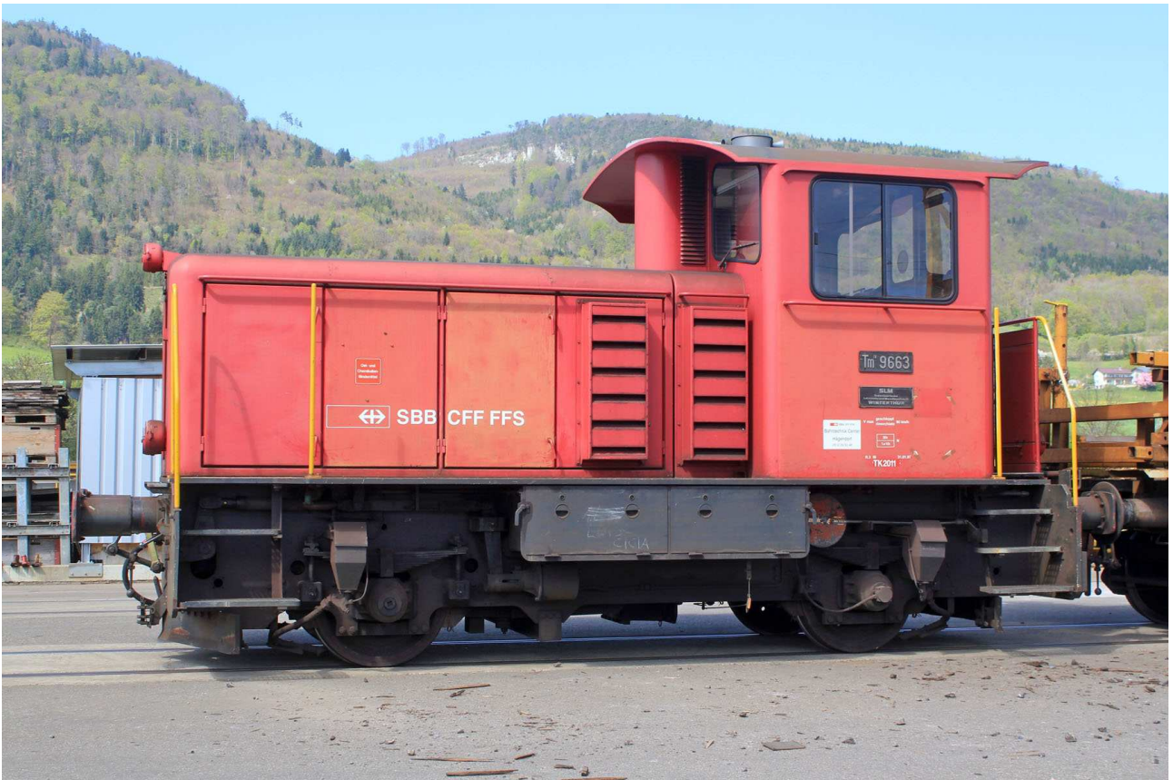
SBB Tm IV 9683