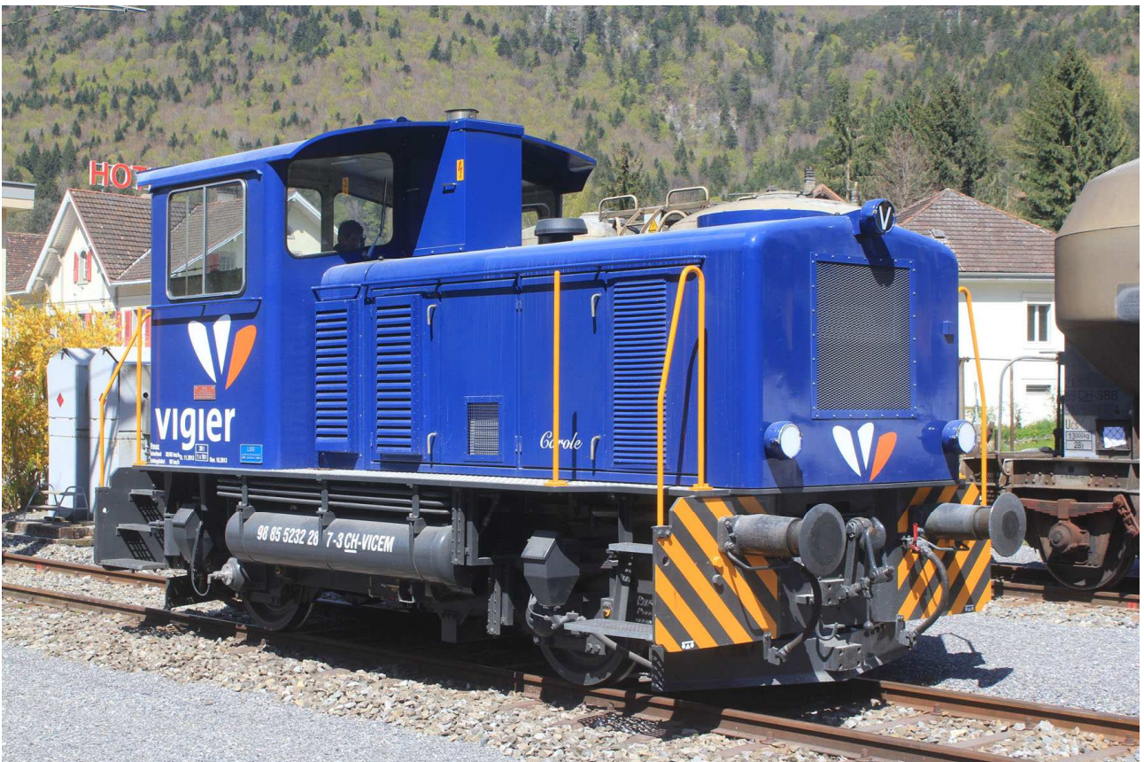
VIGIER Tm 232 287