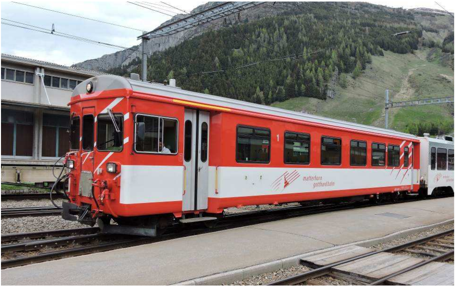
Voiture-pilote ABt 4182 pour le Furka-Oberalp (1986) Steuerwagen ABt 4182 für die Furka-Oberalp Bahn (1986)