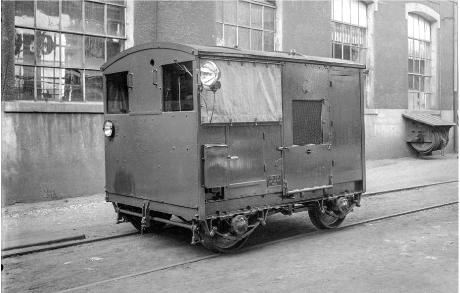
Tracteur Tm 951 avec équipement pour la soudure pour les CFF (1921) Traktor Tm 951 mit Schweissanlage für die SBB (1921)