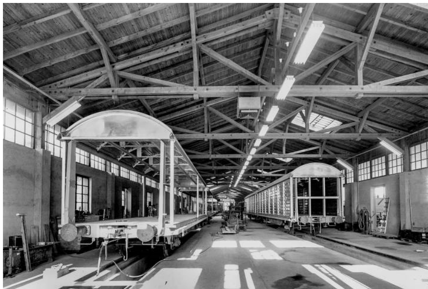
Halle de montage des wagons marchandises Montagehalle für Güterwagen

* = année de commande, sinon année de livraison