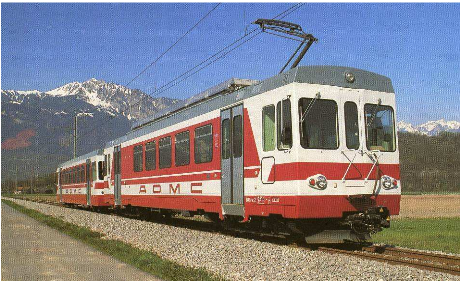
Train navette Beh 4/4 + Bt pour l'AOMC (1986) Photo Vevey Pendelzug Beh 4/4 + Bt für die AOMC (1986) Technologies